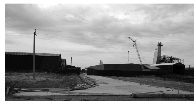
Фото и материал Ларисы КЛАММ