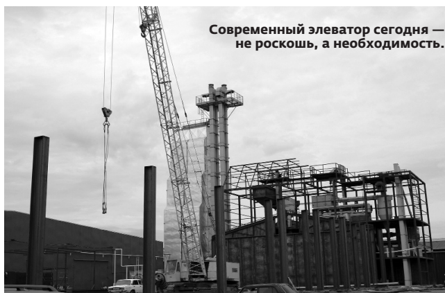
Современный элеватор сегодня — не роскошь, а необходимость.

Подовинновские механизаторы основательно подготовились к уборочной кампании. И можно не сомневаться: уборка урожая пройдет «без проволочек». Немного времени, и большегрузные КАМАЗы повезут с поля на ток зерно нового урожая.