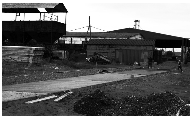
Бетонируются подъездные пути