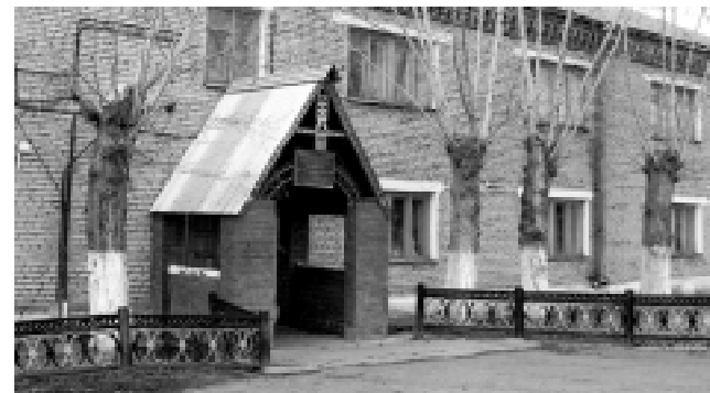
Октябрьская детская школа искусств