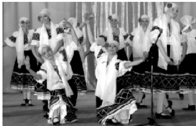
Образцовый хореографический коллектив

Одно из самых востребованных отделений ДШИ — хореографическое, преподавателя